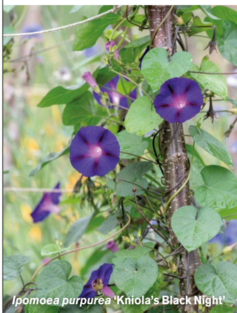
Ipomoea purpurea 'Kniola's Black Night'